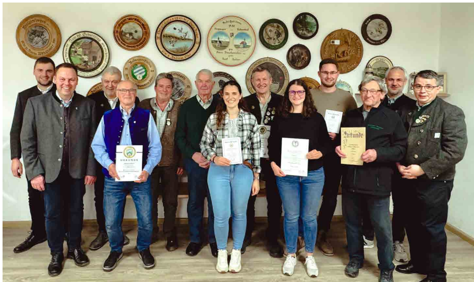
Alle geehrten Vereinsmitglieder